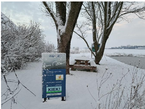
Planten, dieren, luchten