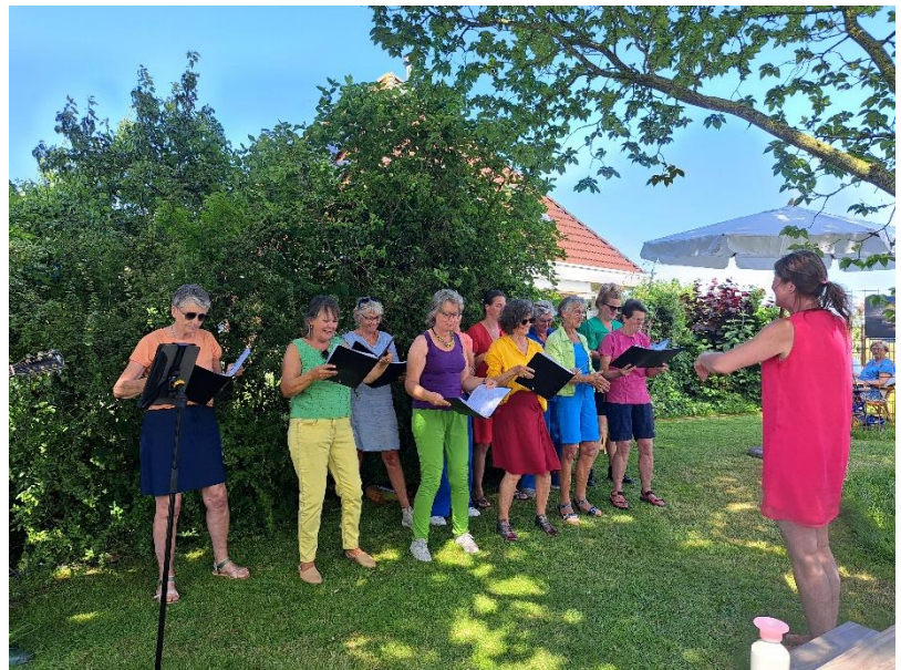
Middag Humsterland wandeltocht